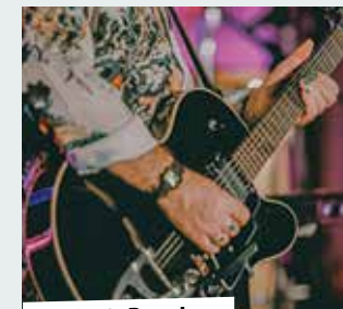
19. Juni: Burgjazz

8.00 bis 12.30 – Wochenmarkt. 16.00-20.00 – Cittaslow-Abendmarkt. Genießen und verweilen im schönen Innenhof der Burg Lüdinghausen. Dieses Mal steht der Markt unter dem Motto „Cittaslow“. Weitere Händler und Stände ergänzen das Angebot. Veranstalter: Lüdinghausen Marketing