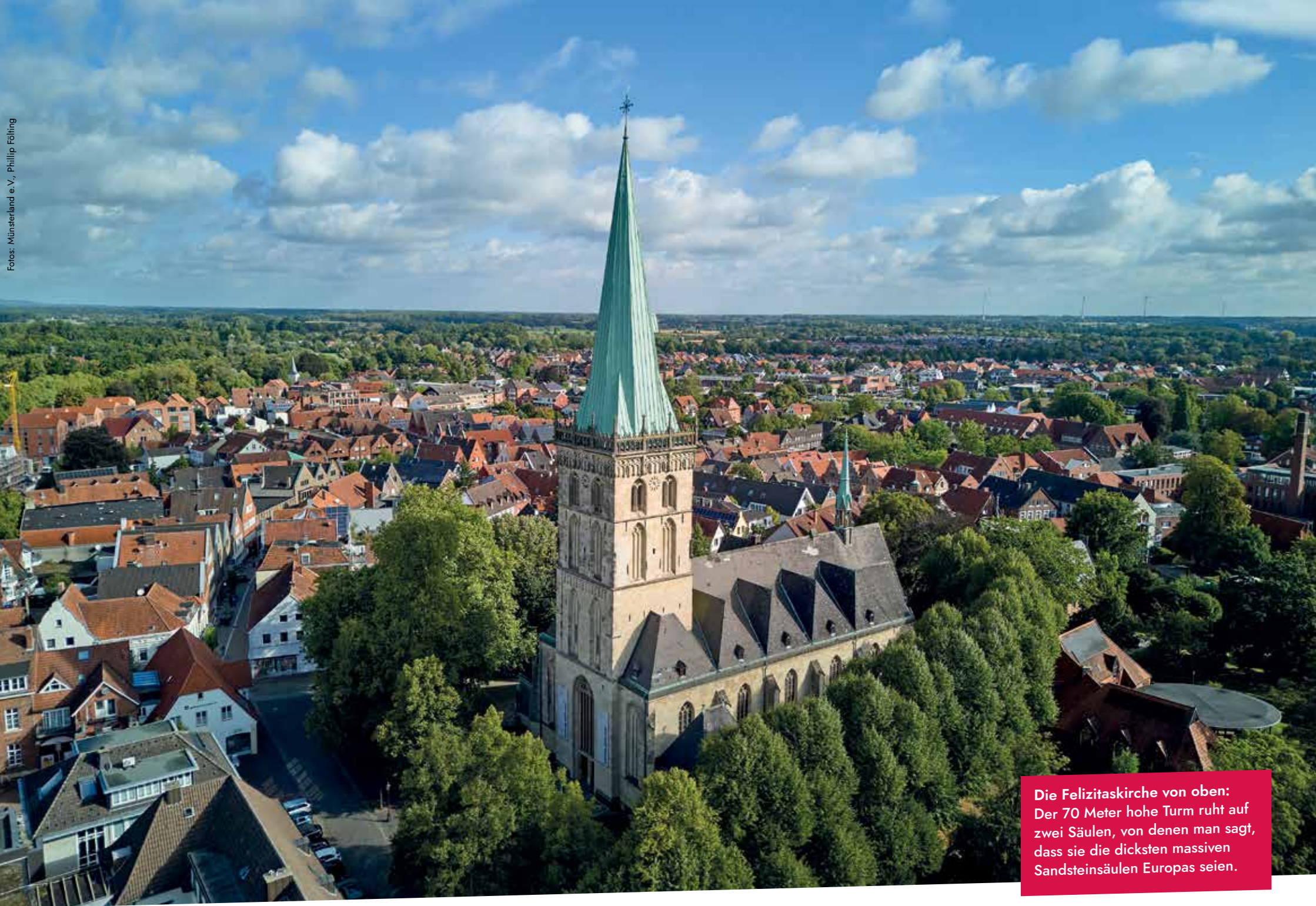
Die Felizitaskirche von oben: Der 70 Meter hohe Turm ruht auf zwei Säulen, von denen man sagt, dass sie die dicksten massiven Sandsteinsäulen Europas seien.