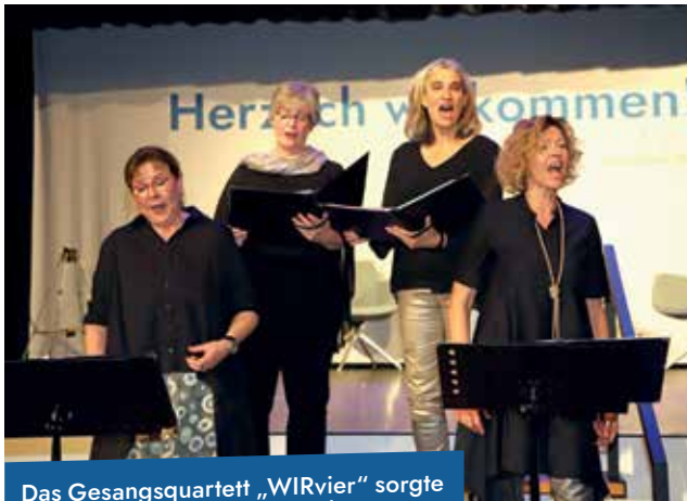
Das Gesangsquartett „WIRvier“ sorgte für die musikalische Unterhaltung.