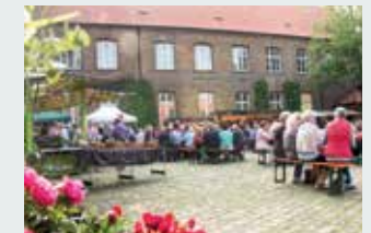
2. u. 4. Freitag i. Monat (April bis Okt.): Abendmarkt