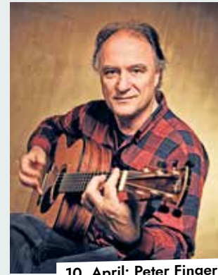
10. April: Peter Finger

20.00 – Konzert: Peter Finger. Wer sich für Gitarrenmusik oder, noch besser, für Akustikgitarrenmusik interessiert, kommt an diesem Namen kaum vorbei. Seit den 70ern genießt Peter Finger international einen herausragenden Ruf als Akustikgitarist und die Musikpresse zählt ihn zu den weltbesten Gitarristen. Ricordo; Einlass: 19 Uhr (Tickets: 21 Euro im Vorverkauf, 23 Euro an der Abendkasse), www.ricordo.de