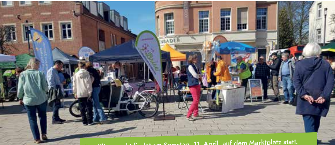
Der Klimamarkt findet am Samstag, 11. April, auf dem Marktplatz statt.