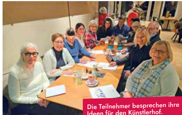
Die Teilnehmer besprechen ihre Ideen für den Künstlerhof.

Die Aktion „Kunstvoll shoppen“ findet vom 11. April bis zum 9. Mai statt. Dann zeigen verschiedene Künstler ihre Werke in Schaufenstern in Lüdinghausen und Seppenrade.