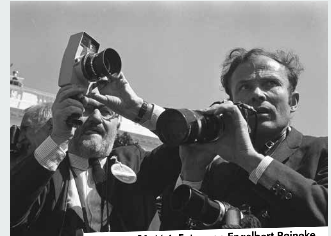
Bis zum 31. Mai: Fotos von Engelbert Reineke

Augen – Blick – Winkel: Als Fotograf des Bundespresamtes dokumentierte Engelbert Reineke von 1966 bis 2004 zentrale politische Ereignisse. Mit Fotografien wie dem Kniefall Willy Brandts oder den letzten Porträts Konrad Adenauers schuf er Bilder, die sowohl das kollektive Bildgedächtnis als auch unsere Vorstellungen von Politikgeschichte bis heute prägen. Mit einer erstmals ausschließlich Reineke gewidmeten Ausstellung präsentiert die Burg Vischering unter anderem originale Abzüge aus dem eigenen Bestand des Fotografen. Burg Vischering (bis 31. Mai). Eintritt: 3,50 Euro, erm. 2 Euro