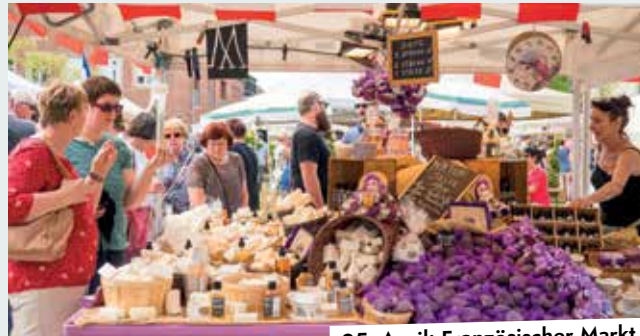
25. April: Französischer Markt