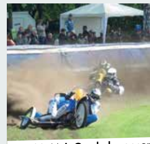
13./14. Mai: Grasbahnrennen

18.00 – Seppenrade mitterdrin. Gemütliches Miteinander bei Musik, Getränken und Snacks. Kirchplatz Seppenrade.