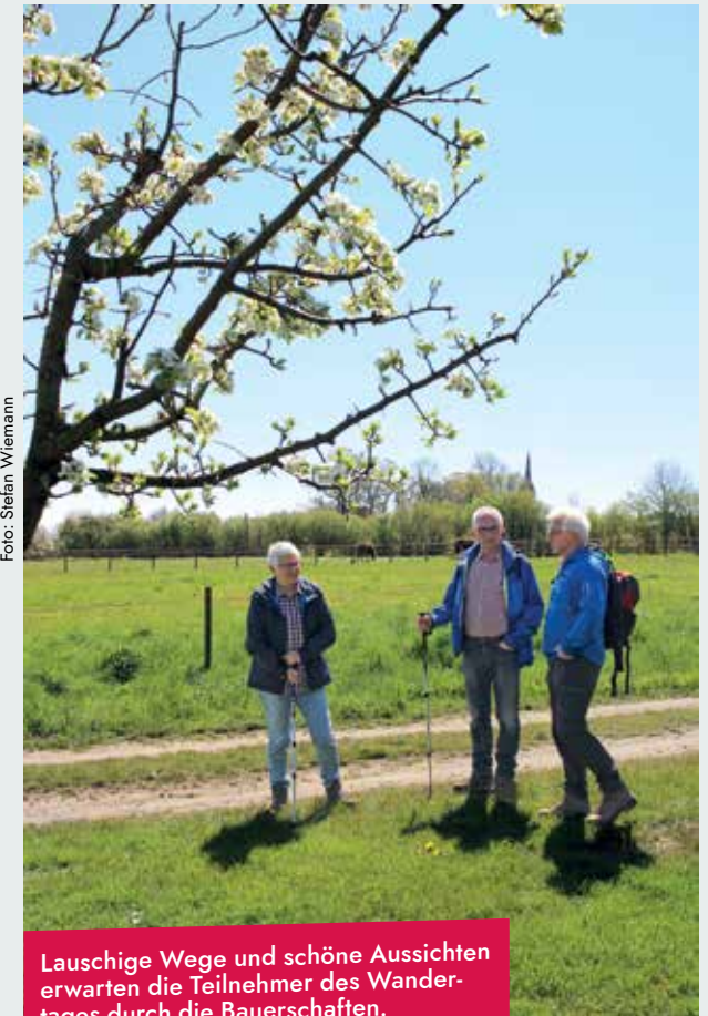
Lauschige Wege und schöne Aussichten erwarten die Teilnehmer des Wandertages durch die Bauerschaften.

stieg aber auch überall unterwegs möglich. Der Heimatverein Seppenrade bietet im Rosengarten Kaffee und Kuchen und Gegrilltes an. Unterwegs sorgt die Landjugend Seppenrade für ein gastronomisches Angebot, an der Emkumer Schule können die Wanderer einkehren und es sich gut gehen lassen. Für den Wandertag ist keine