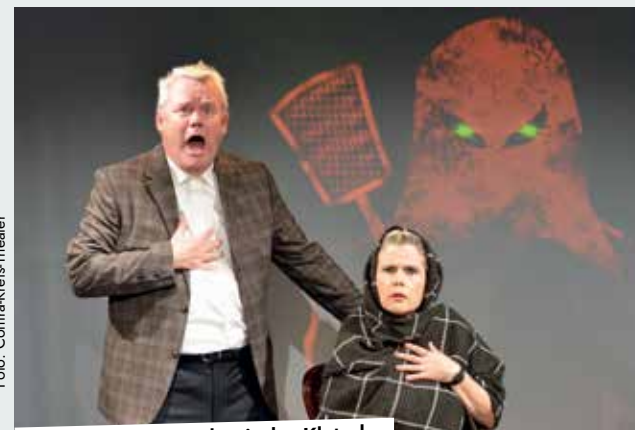
6. März: Der Mönch mit der Klatsche

„Selbst“ mit Meditation, Innenschau, Systemaufstellung zu privaten und beruflichen Themen. Anmeldungen unter info@arcoagency.art oder 02591/8949727. Veranstaltungsort: Im Reitstall vom Naundrups Hof. Kosten: Jede Teilnehmerin entscheidet selbst, wie viel sie gibt. 13.00 – Lesung. Der LIT LH lädt zur Lesung in den Kapitelsaal der Burg Lüdinghausen ein. Vorgestellt werden einige Geschichten aus der neuen Anthologie. Die Geschichtensammlung kann man dort käuflich erwerben. Das Buch erscheint am 14. Februar und ist bereits bei der @agenturbuchfunke und unter www.eddabork.de vorbestellbar. Der Eintritt ist kostenlos.