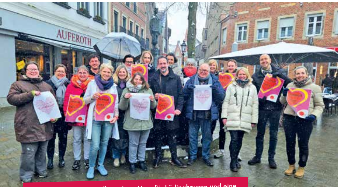
Lüdinghauser Einzelhändler zeigen Herz für Lüdinghausen und eine lebendige Innenstadt. Bis zum 31. März läuft die Stempelaktion.

Heimatshoppen: Seit Mitte Februar läuft die Stempelkarten-Aktion von Lüdinghausen Marketing gemeinsam mit 35 Händlern aus unserer Stadt.