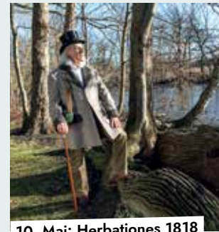
10. Mai: Herbationes 1818