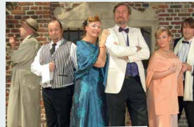
27.1. Lord Moad lässt bitten