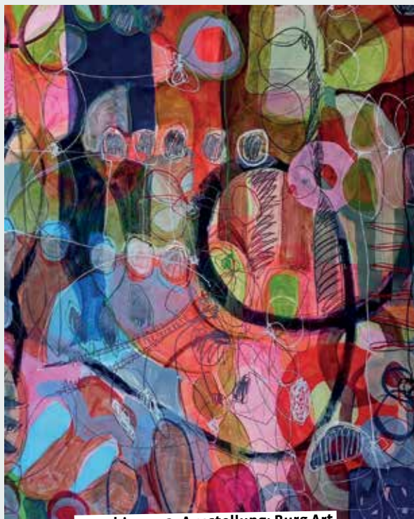
5.11. bis 17.12. Ausstellung: Burg Art

BurgArt (5.11. bis 17.12.): Die Burg Art in der Renaissanceburg Lüdinghausen findet traditionell am Ende des Jahres statt. In dieser vorweihnachtlichen Präsentation bieten 8 bis 10 Künstler aus unterschiedlichen Bereichen der Bildenden Kunst (Malerei, Plastik, Objekte etc.) und des Kunsthandwerkes (Schmuck