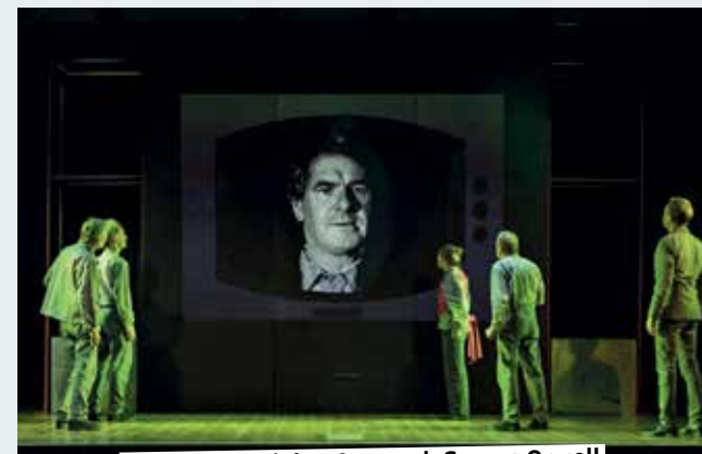
3.12. Schauspiel: 1984 – nach George Orwell

Gäste an diesem Abend vor, zwischen und nach dem Essen. Naundrups Hof (Tickets für 79 Euro inklusive Begrüßungsgetränk und 3-Gang-Menü gibt es ausschließlich direkt im Naundrups Hof oder per Telefon unter 0259178002) 19.00 – Tatort-Dinner. Bei einem vortrefflichen 4-Gänge-Menü erleben die Zuschauer Sex & Crime mit Hamburger Flair und norddeutschem Witz. Musik mit Live-Gesang, Table-Dance und ein spannender Mordfall sorgen für einen sensationellen Abend. Tickets für 75 Euro (inkl. Menü) gibt's im Steverbett-Hotel und