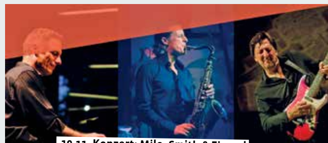
19.11. Konzert: Milo, Smith & Fimpel

8.00 bis 12.30 – Wochenmarkt. 19.30 – Plattdeutsches Theater. Theatergruppe Seppenrade. Heimathaus im Rosengarten