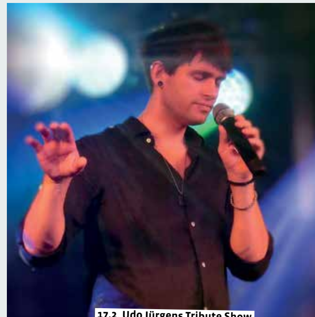
17.2. Udo Jürgens Tribute Show