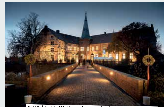
2. und 3. 12. Weihnachtsmarkt der Hobbykünstler

11.00 bis 18.00 – Weihnachtsmarkt der Hobbykünstler. Pünktlich zum ersten Advent beginnt in Lüdinghausen die Zeit der winterlichen Märkte. Am ersten Adventswochenende öffnet der beliebte Weihnachtsmarkt der Hobbykünstler in der Burg Lüdinghausen und im Bauhaus seine Tore. Rund 50 Aussteller verwandeln die historischen Gemäuer in einen Basar der Extraklasse und präsentieren weihnachtliche Dekorationen und Geschenkartikel. Für Speisen und Getränke ist gesorgt.